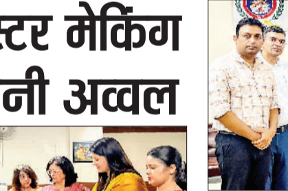
सोनीपत। प्रतियोगिता के दौरान पोस्टरस का अवलोकन करते निर्णायक मंडल।