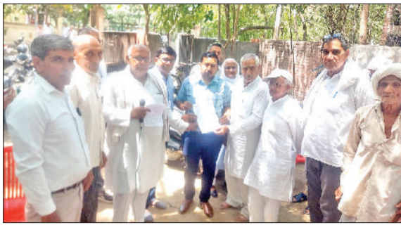
सोनीपत। नायब तहसीलदार को ज्ञापन सौंपते हुए संघ के पदाधिकारी एवं सदस्यगण।