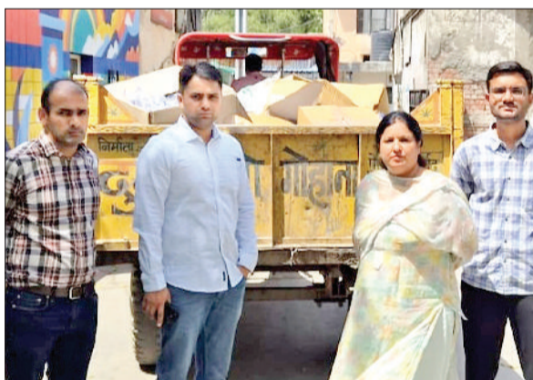
गोहाना। जब्त प्लास्टिक के साथ संयुक्त टीम के अधिकारी।