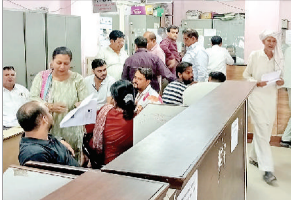
सोनीपत। चुनाव प्रक्रिया शुरू होने पर नगर निगम में लगी लोगों की भीड़।