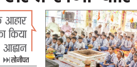
सोनीपत। आर्य समाज मॉडल टाउन में आयोजित कार्यक्रम में उपस्थित विद्यार्थी।

हड़ताल पर बैठे दमकल कर्मचारियों की सभी जायज मांगों का पत्र जारी नहीं किया तो नगरपालिका कर्मचारी संघ इनके समर्थन में 1-2 मई को दो दिवसीय हड़ताल करने पर विवश होगा।