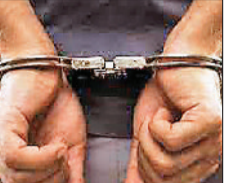
■ मुखल के पास युवक से मोबाइल, सोने का कड़ा व नकदी लूटने का आरोपी