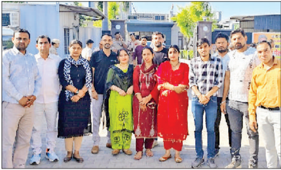
सोनीपत। धरने पर पहुंचे सोनीपत के एलसीएलओ कर्मचारी।